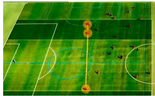
サッカー空撮による映像解析