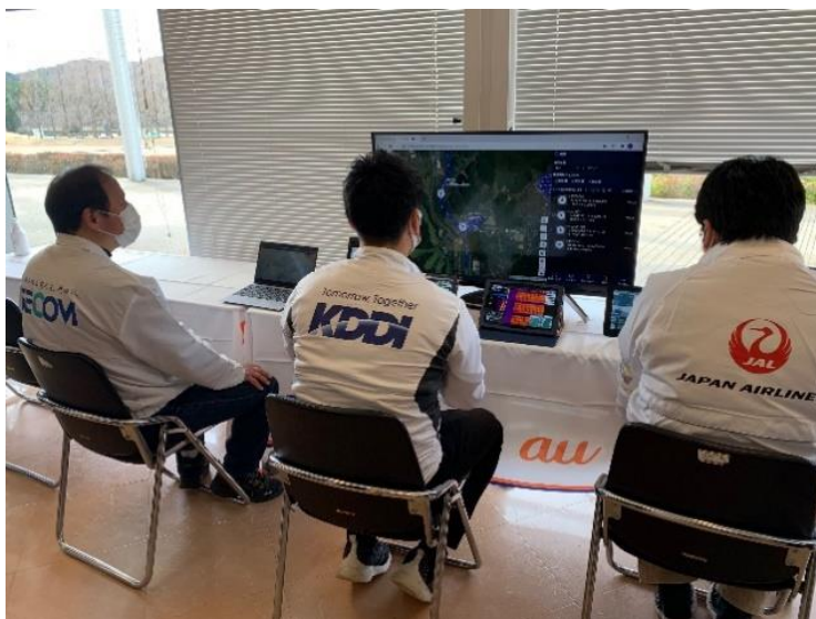
管制室にて飛行を監視