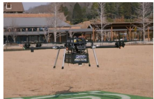
医薬品物流ドローン