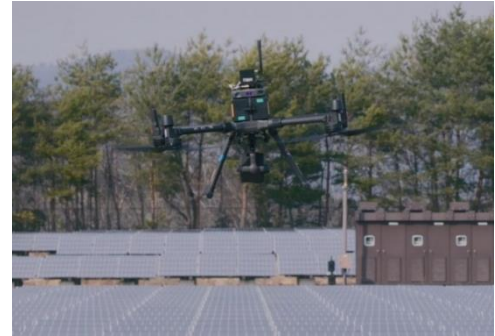
太陽光パネルの点検ドローン